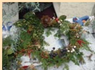
ネイチャークラフト