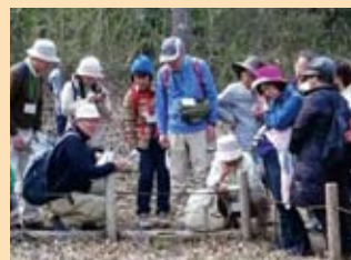
ネイチャーガイド