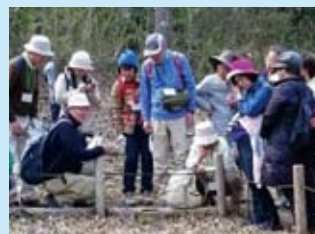
ネイチャーガイド