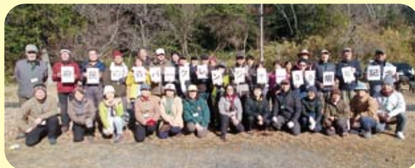
大阪府民の森パークレンジャー 30周年

大阪府民の森パークレンジャーは、大阪府民の森園地をフィールドにして自然にかかわる活動をするボランティアです。 私たちは、自然公園とそこを訪れる人々をつなぐパイプ役として、色々な自然の体験活動を通じて自然の大切さを伝えています。 詳しくは、下記ホームページをご覧ください。