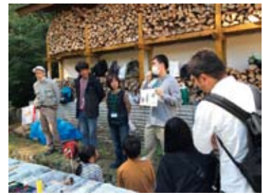
イベント実施の様子

大阪府民の森パークレンジャーになるには、パークレンジャー養成講座を受講してNPO法人日本パークレンジャー協会に入会して下さい。 講座では、自然の見方や考え方、パークレンジャーと歩いて園地を知るハイキング、野外活動での安全管理や救急法、自然素材のクラフトや催し企画の仕方など、ボランティア活動の実践について楽しみながら学びます。講座の講師は森林インストラクターや経験豊富なパークレンジャーが指導します。